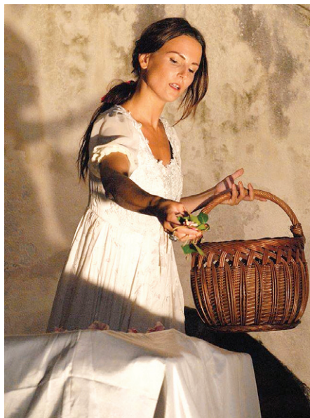
Premijera predstave je u siječnju 2019.